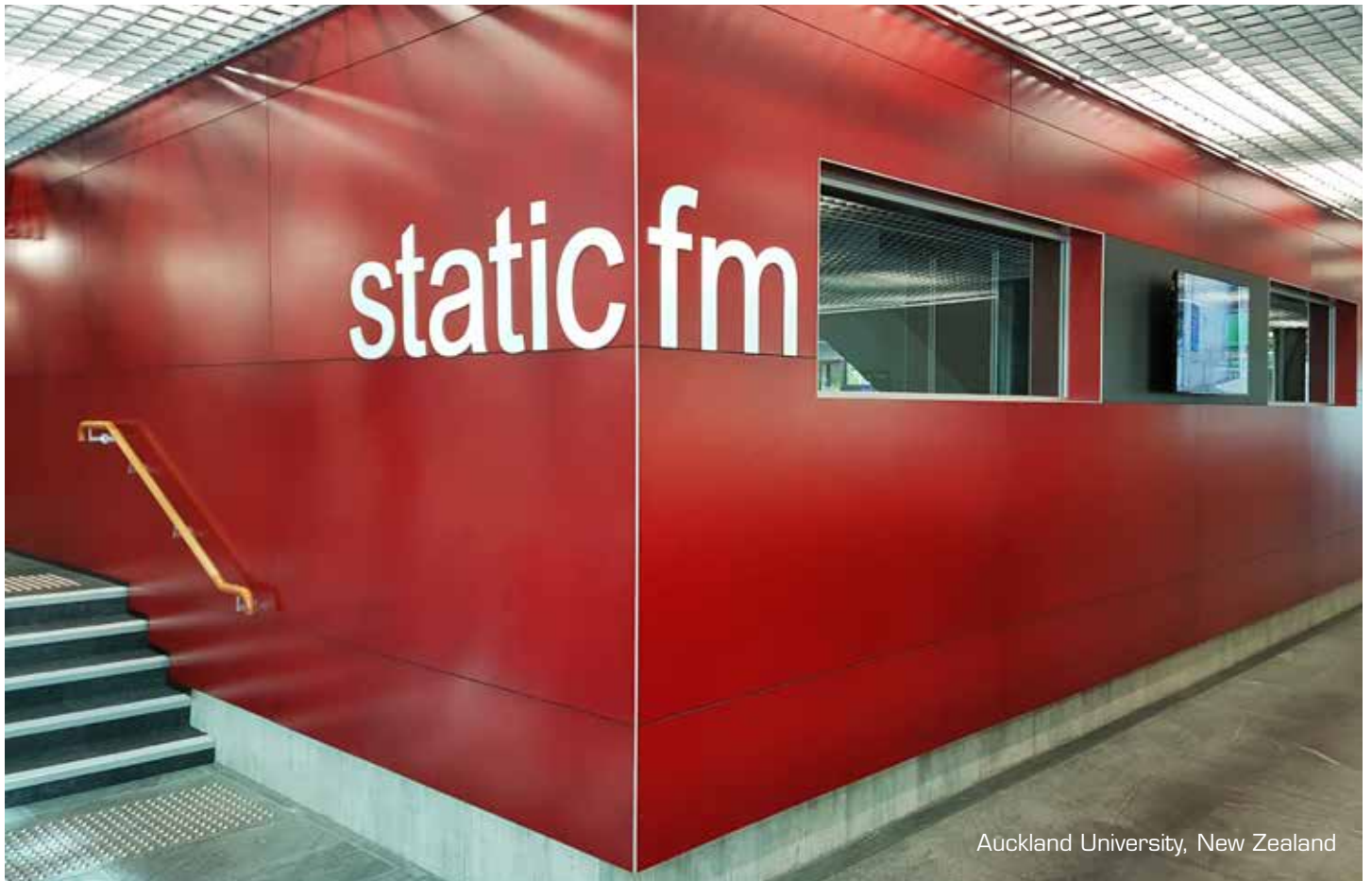
Auckland University, New Zealand