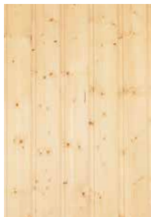
Terveoksainen kuusi, TK