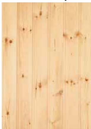
Oksainen mänty, OM