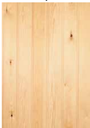
Vähäoksainen mänty, VM